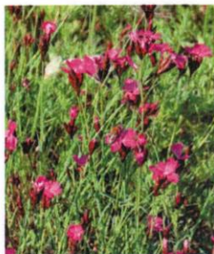
Karthäuser-Nelke Dianthus carthusianorum