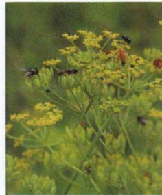
Wiesen-Pastinak Pastinaca sativa