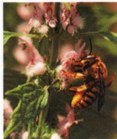
Echtes Herzgespann Leonurus cardiaca