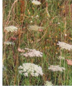
Wilde Möhre Daucus carota

Blüte weiß, cremefarben oder schwach rötlich Mai bis Juli