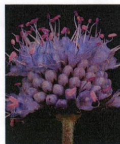
Gewöhnlicher Teufelsabbiss Succisa pratensis

Blüte lila bis dunkelblauviolett Juli bis September