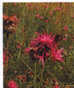
Skabiosen- Flockenblume Centaurea scabiosa

Blüte purpurn bis bläulich-rosa Juni bis Oktober