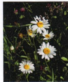
Wiesen-Margerite Leucanthemum ircutianum