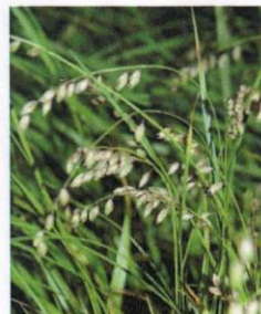
Gewöhnliches Wimper-Perlgras Melica ciliata