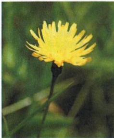
Rauher Löwenzahn Leontodon hispidus