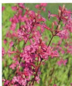
Echte Pechnelke Silene viscaria