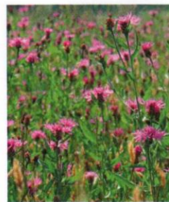
Wiesen-Flockenblume Centaurea jacea

Blüte blass bläulich-rosa bis purpurn Juni bis Oktober