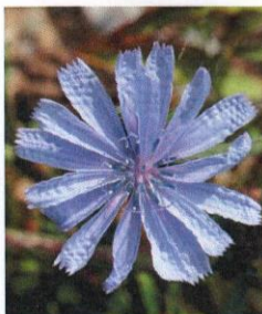
Wegwarte Cichorium intybus