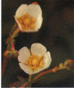
Felsen-Fingerkraut Potentilla rupestris