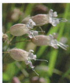
Taubenkropf- Leimkraut Silene vulgaris