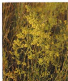
Echtes Labkraut Galium verum